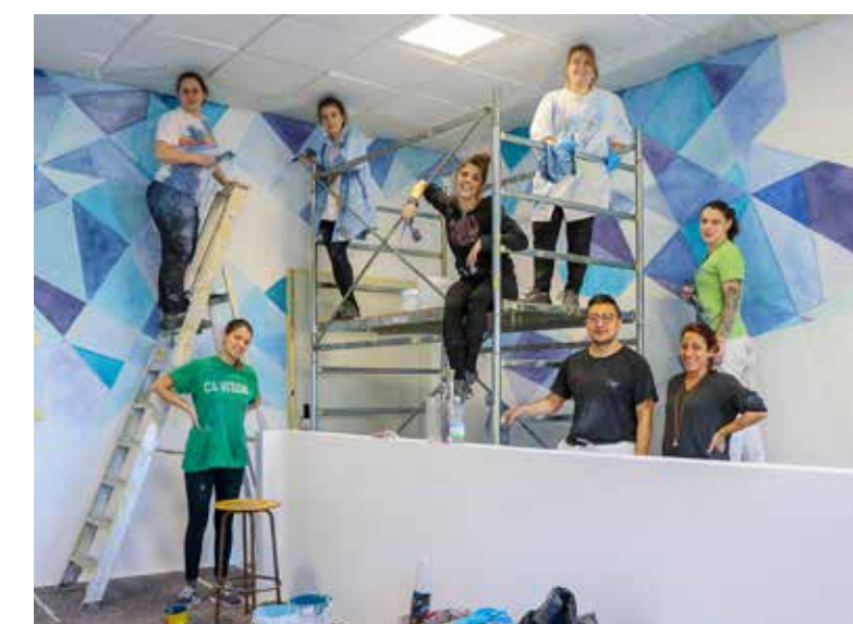
Sopra: studenti dell'Accademia e alcune realizzazioni