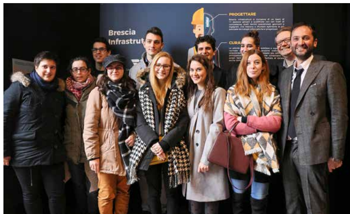
A fianco: studenti e docenti all'inaugurazione della mostra di Brescia Infrastrutture

Preparazione e disponibilità del corpo docente / Espressività creativa e acquisizione di competenze professionali di livello europeo / Ambiente familiare ed accogliente / Metodi interattivi con le realtà produttive del territorio / Spazi laboratoriali altamente tecnologici / Ottimo rapporto qualità-prezzo / Corsi a misura di studente / Attività extra-curricolari / Possibilità di formazione, studio e tirocinio all'estero.